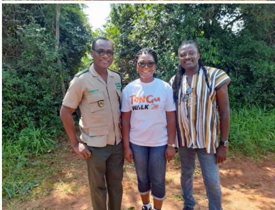
Vertreter der Forestry Commission von Ghana und der African Afforestation Association bei der Pflanzaktion im Wald von Achimota in Accra / Ghana

=> (i) die Unterstützung anderer gemeinnütziger Organisationen im In- und Ausland in den Bereichen Entwicklungszusammenarbeit, Humanitäre Hilfe, Völkerverständigung und bürgerschaftliches Engagement, insbesondere in Bezug zum Projektmanagement, zu Wissenstransfers und zur Öffentlichkeitsarbeit.